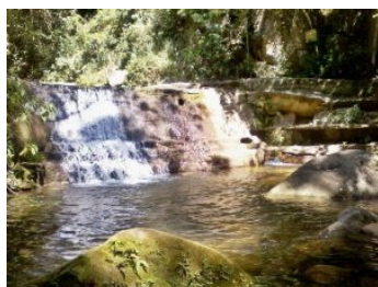
1- Cachoeira Pico da Lagoinha

A Área de Proteção Ambiental Estadual de Maricá é uma área tipicamente de restinga, localizada na costa do município. É formada pela antiga fazenda São Bento da Lagoa, a Ponta do Fundão e a Ilha Cardoso. Abriga a Comunidade Pesqueira tradicional de Zacarias, presente na área desde o século XVIII, sítios arqueológicos e o complexo ecossistema de restinga.