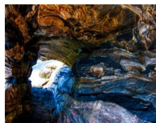
3- Gruta de Ponta Negra

Ponto de referência para os antigos navegadores, o Farol de Ponta Negra está incorporado ao patrimônio turístico e cultural da cidade.