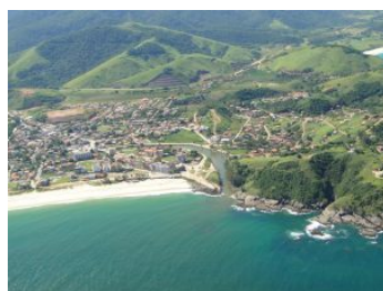
2 – Ponta Negra

Localizada no ponto mais alto do município, no Espreado, a Cachoeira do Pico da Lagoinha serve de tríplice divisa entre Maricá, Tanguá e Saquarema. É local ideal para excursões.